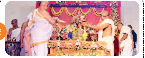
नित्यानंद प्रभु अवतरण तिथि पर भक्ति महोत्सव, हुआ विग्रहों का महाभिषेक