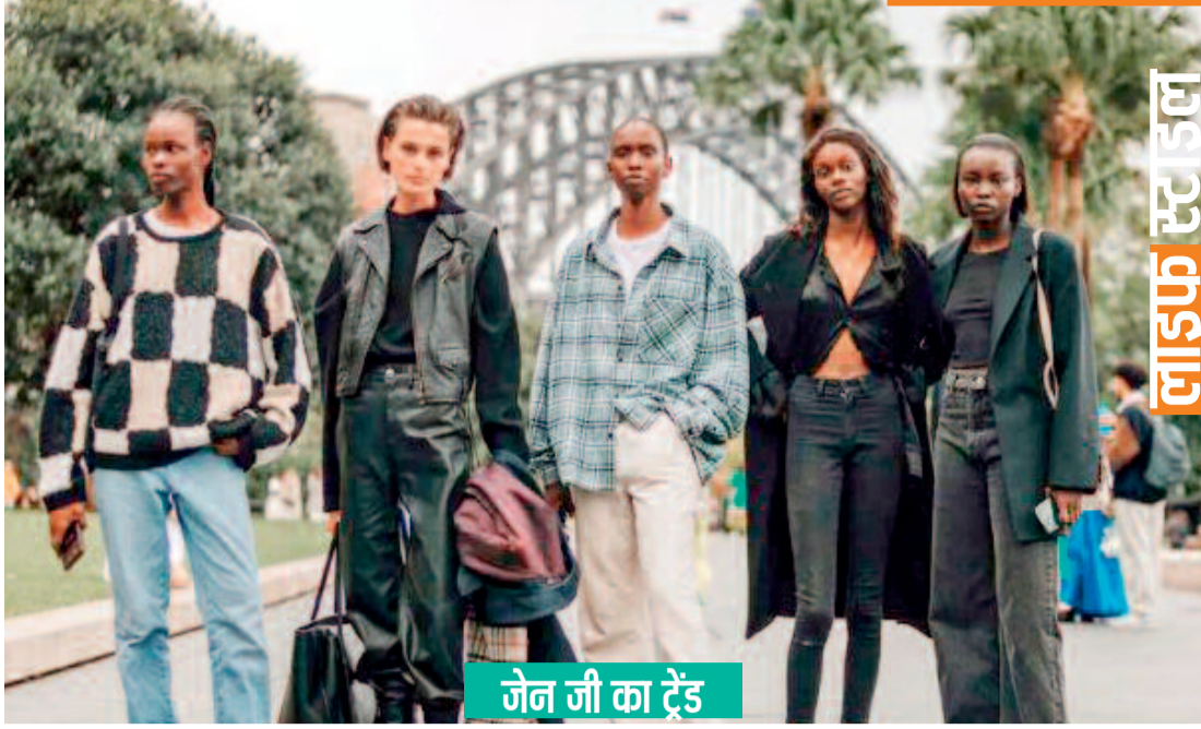
जेन जी का ट्रेंड